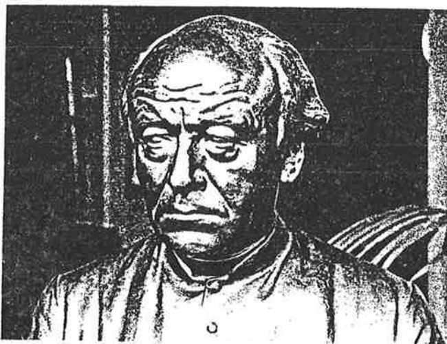
Borstbeeld van Guido Gezelle, door beeldhouwer Jules Lagae.

Hammeneckers opstel is eerder een vrij onkritische hulde aan een aanbeden idool, een wat opgeschroefde evokatie van Gezelles verbeeldingswereld en tenslotte een verlangen plechtstatige belofte om "het heilig ideaal" van Gezelle na te volgen.